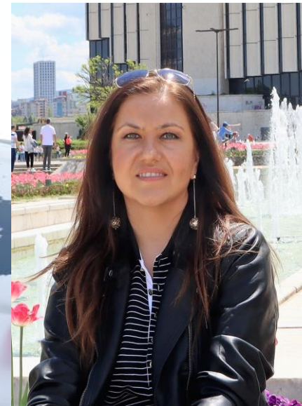
Христина Добрева Национално контактно лице от публичната администрация, Министерство на транспорта и съобщенията