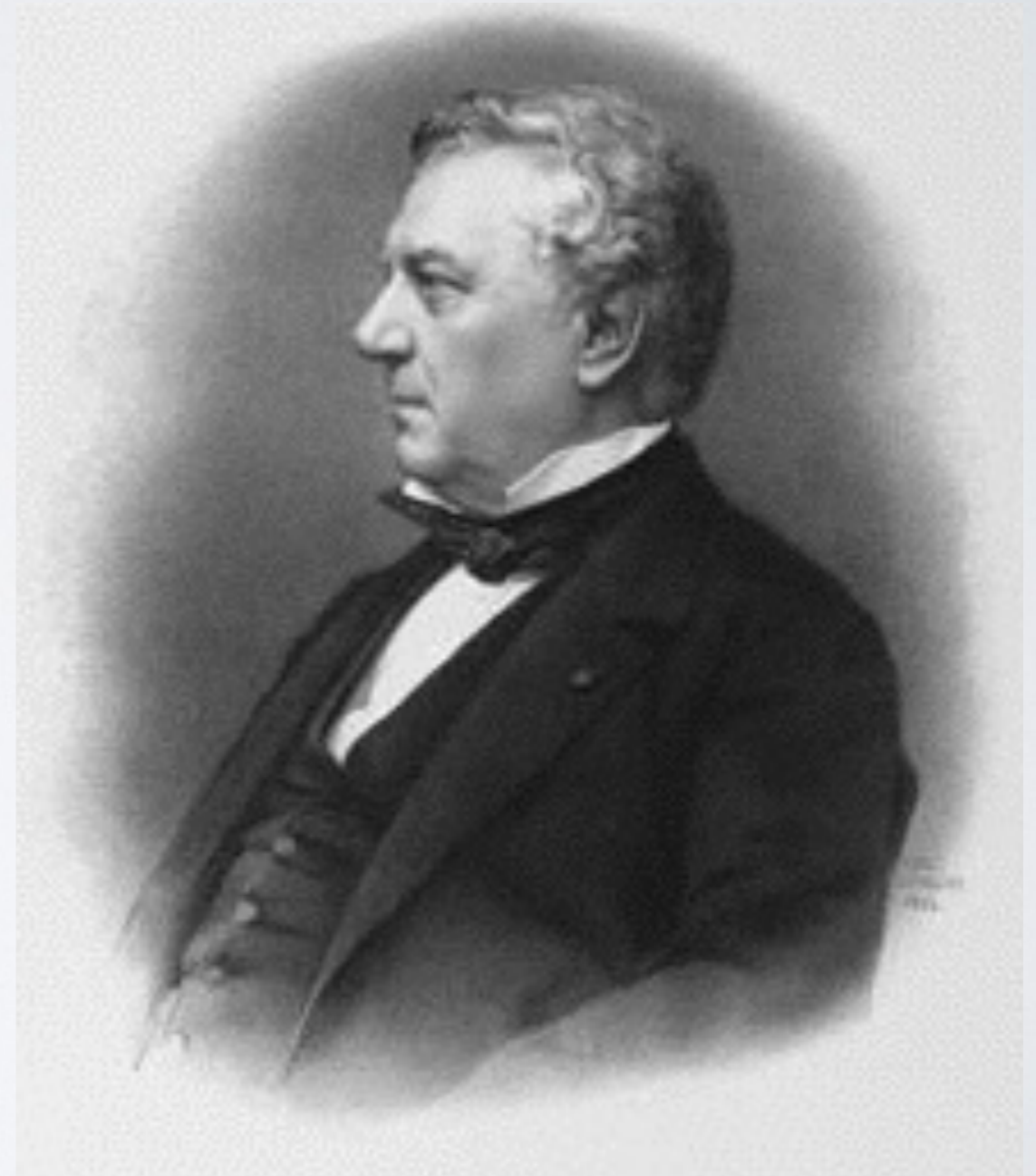
Augustin-Charles Renouard, 1794-1878.